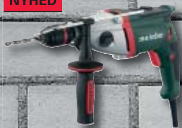
SBE 900 Impuls