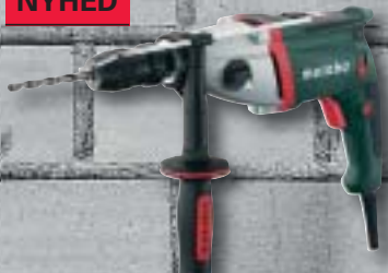
SBE 1100 Plus