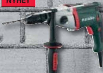
SBE 900 Impuls