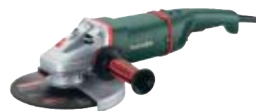
W 24-230/WX 24-230